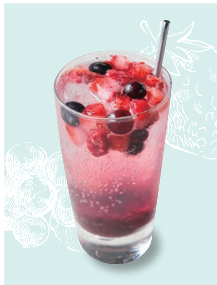
ベリーベリー自家製サワー Housemade Berry Sour