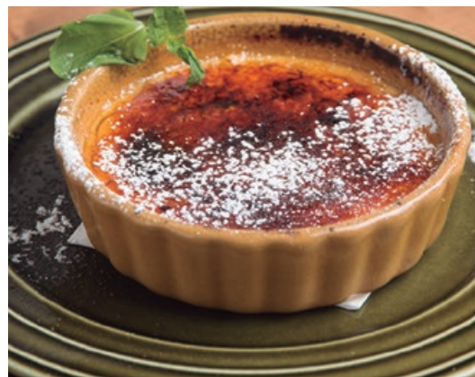
クレームブリュレ 650 Crème brûlée オーダーが入ってから表面をバリバリに焼き上げます!