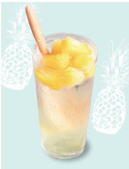
パイナップルの 自家製サワー Housemade Pineapple Sour