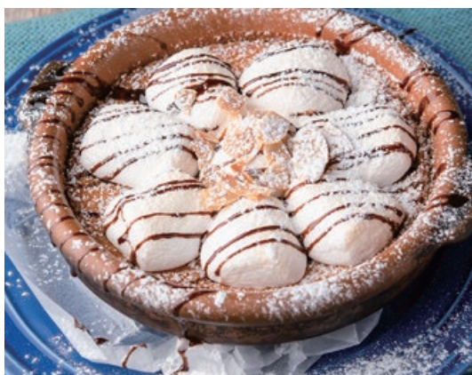
あつあつまシューマロチーズスフレ 750 Hot marshmallow Cheese soufflé とろーりとろけるマシューマロの下には、ふんわりとした チーズスフレ。冷めないうちにどうぞ!