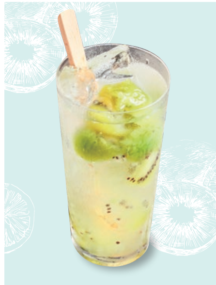
キウイの自家製サワー Housemade Kiwi Sour