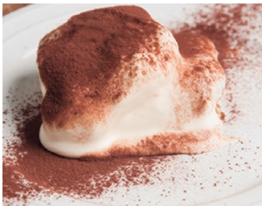
自家製ティラミス 650 House made Tiramisu 香り高いエスプレッソがしみこんだスポンジ生地に 特製マスカルポーネクリームを重ねた、自信作!