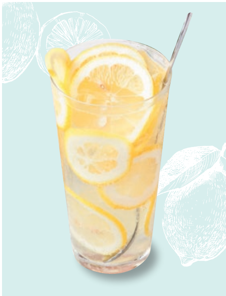
自家製レモンサワー Housemade Lemon Sour