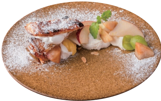
季節のフルーツ ミルフィーユ仕立て Seasonal Fruits Mille-feuille