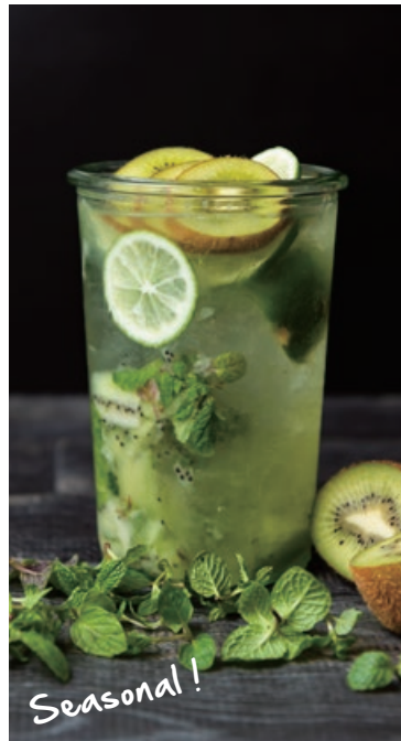
キウイの ノンアルコールモヒート Non-alcoholic kiwi mojito