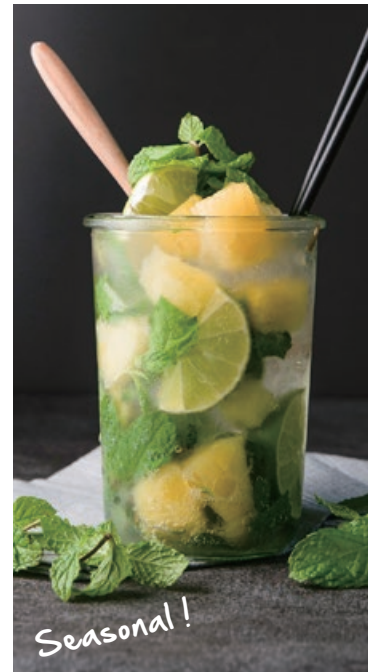
パイナップルの ノンアルコールモヒート Non-alcoholic Pineapple mojito