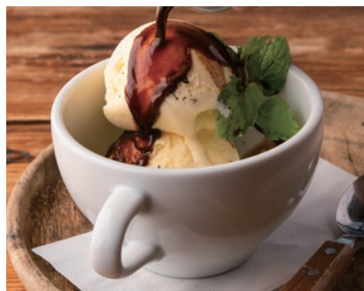
アффォガード 600 Affogard バニラアイスにほろ苦いエスプレッソをかけて。 食後はもちろん、お酒と一緒に召し上がっても◎。

1階ショーケースのデザートもご注文いただけます。 ご注文は2階スタッフにお声かけ頂くか、または 1階カウンターにてお申し付けください。