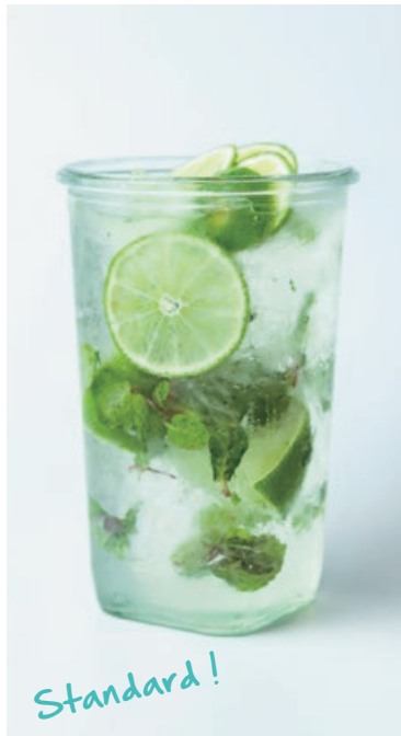
フレッシュネス ノンアルコールモヒート Freshness Non-alcohol Mojito

ザ ローフカフェのノンアルコールモヒート。 ミントとライムをふんだんに使って、さっぱりでも香り高い仕上がります。